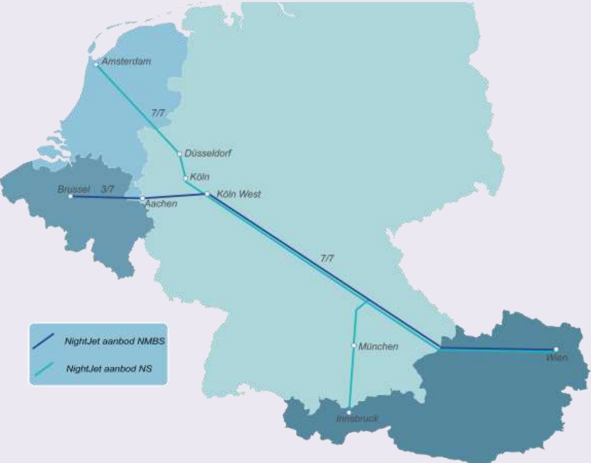
NightJet 2021 – 2023: Brussel – Wenen