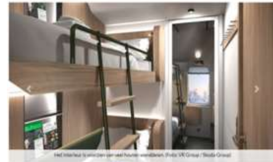
De Finse staatsvervoerder VR zet in op meer nachttreinen. Skoda Group gaat voor de vervoerder tegen slaaptijlgers en acht auto's per trein bouwen. De nachttreinen zullen de reiziger het gevoel moeten geven alsof ze in een hotel overnachten.