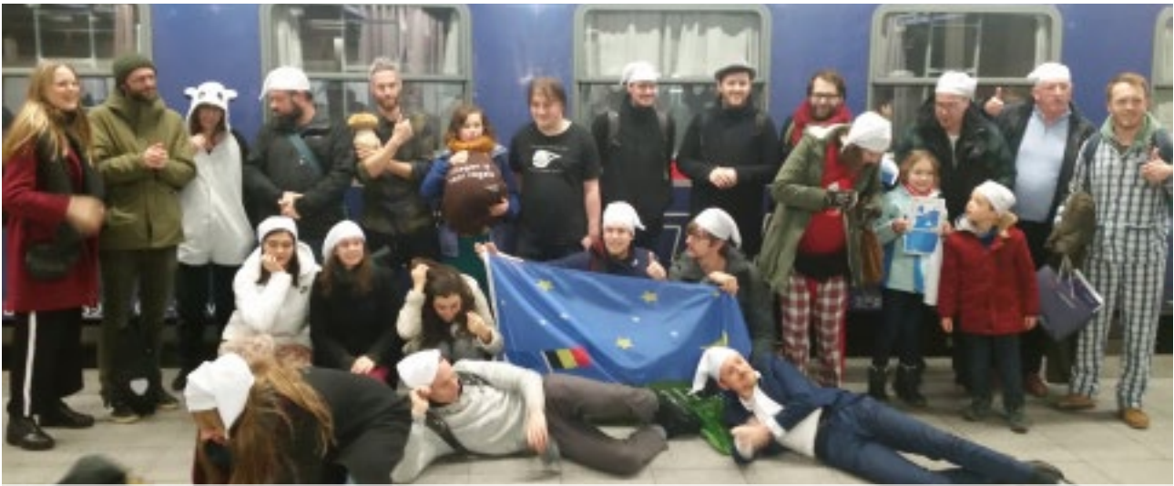
Het vertrek van de eerste Nightjet uit Brussel verliep niet onopgemerkt.