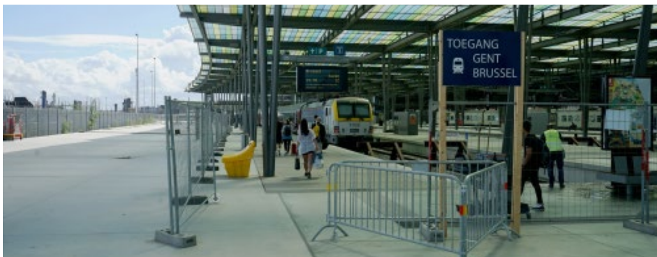
In het station van Oostende werden de vertrekkende reizigers gesorteerd volgens hun bestemming.